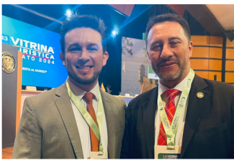
Arturo Bravo Viceministro de Turismo