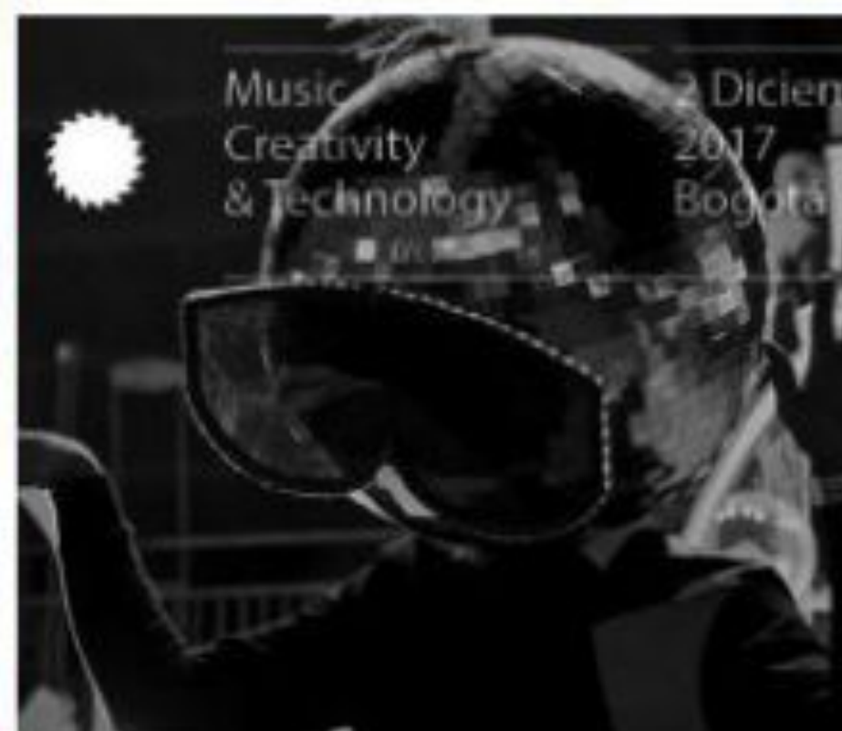
Music Creativity & Technology 2 Diciembre 2017 Bogotá